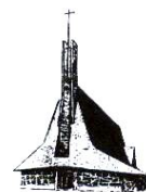
église Ste Bernadette