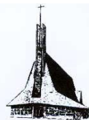
église Ste Bernadette

10 boulevard du Corps Franc Pommiers 64000 PAU Tél. 05 59 02 88 23