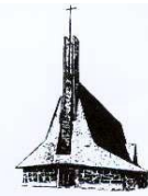
église Ste Bernadette

10 boulevard du Corps Franc Pommiers 64000 PAU Tél. 05 59 02 88 23