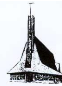
église Ste Bernadette

La Maison de la Fraternité du Secours Catholique vous accueille ce mois de novembre de 15h00 à 18h30, les mercredis 7, 21, les dimanches 11, 18, 25, 4 rue Pierre et Marie Curie. Tél.05 59 90 49 19