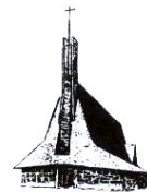
église Ste Bernadette

10 boulevard du Corps Franc Pommiès 64000 PAU Tél. 05 59 02 88 23