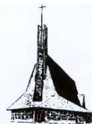
église Ste Bernadette

Messes dominicales et 15 août Messes en semaine et permanences