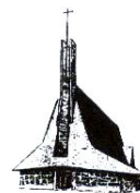
église Ste Bernadette

10 boulevard du Corps Franc Pommiès 64000 PAU