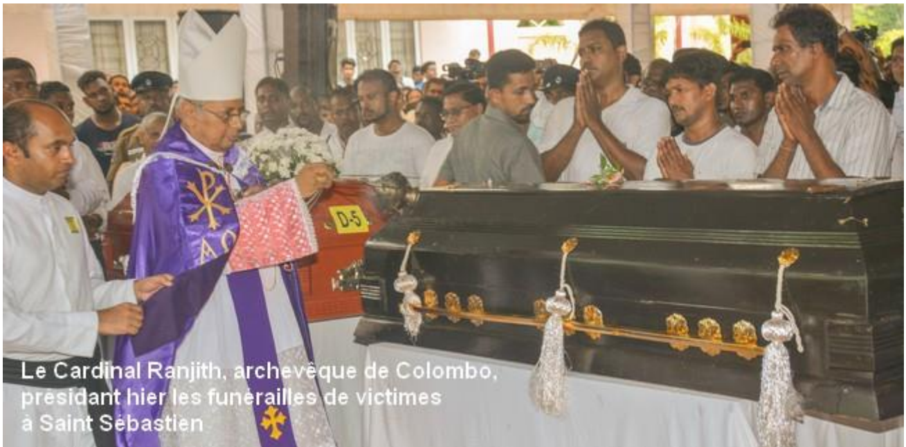
Le Cardinal Ranjith, archevêque de Colombo, présidant hier les funérailles de victimes à Saint Sébastien