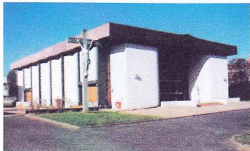
Sainte Thérèse 79 avenue Trespoey 64000 PAU