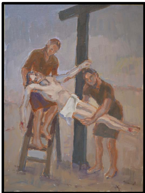
13 ème station : Jésus est détaché de la croix