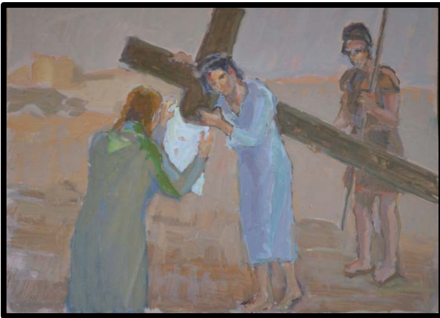
6 ème station : Véronique essuie la face du Christ