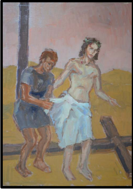
10 ème station : Jésus est dépouillé de ses vêtements