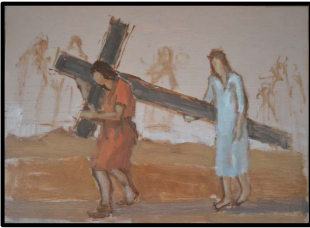
5 ème station : Simon de Cyrène aide Jésus à porter la croix