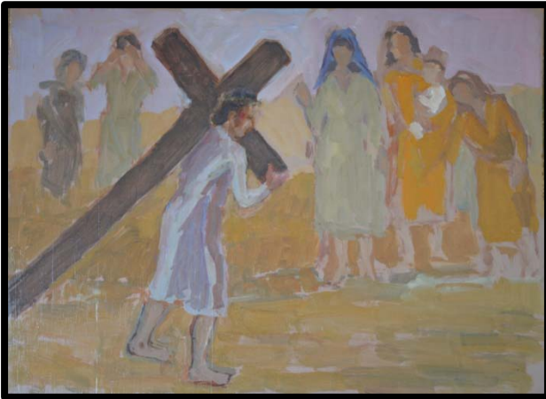
8 ème station : Jésus rencontre les femmes de Jérusalem