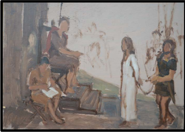
1 ère station : Jésus est condamné à mort