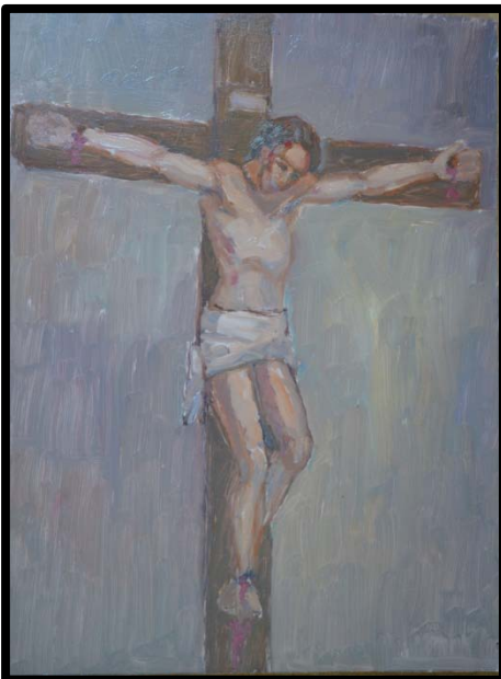
12 ème station : Jésus meurt sur la croix