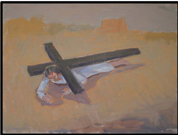
9 ème station : Jésus tombe pour la troisième fois