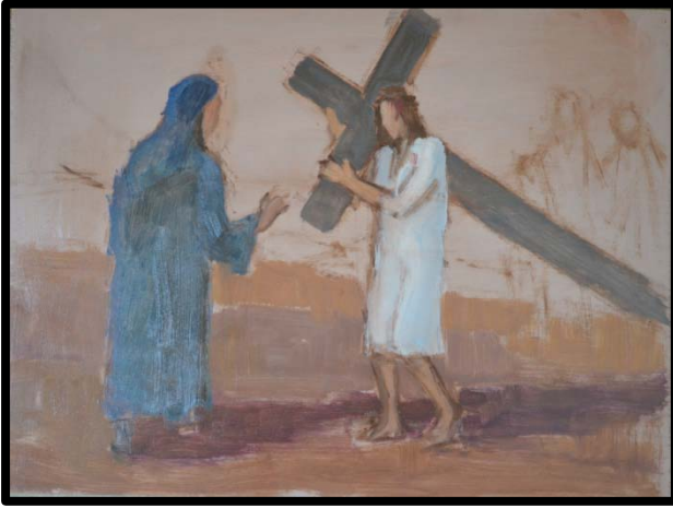
4 ème station : Jésus rencontre sa mère