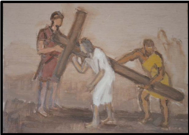
2 ème station : Jésus est chargé de la croix