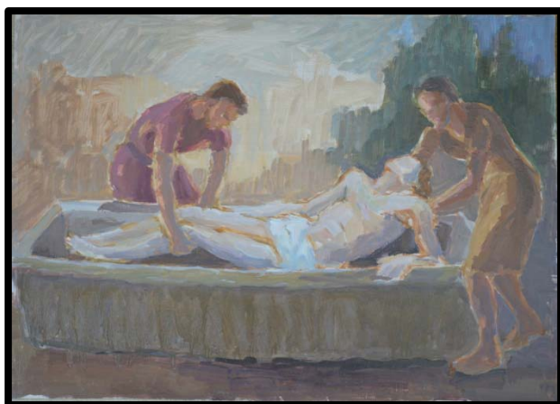
14 ème station : Jésus est mis au tombeau

Les 14 stations de ce chemin de croix sont des peintures à l'huile sur panneaux de bois de 40x30 cm environ.