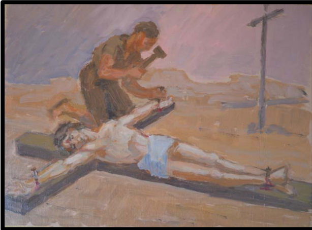
11 ème station : Jésus est mis en croix