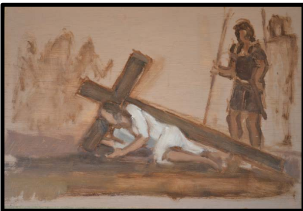
3 ème station : Jésus tombe pour la première fois