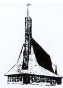
église Ste Bernadette

En novembre : deuxièmes rencontres, dans les lieux habituels, pour « Redécouvrir l'évangile selon saint Matthieu » le 6 ; « Vivre en baptisé » le 12 ; « Les enjeux de l'œcuménisme » le 14 ; « L'Exil dans la Bible et dans nos vies » le 16 ; « Découvrir la petite voie de confiance et d'amour de sainte Thérèse de Lisieux » le 18 ; « Le cœur, organe de vie » avec le Docteur Rossignol le 18.